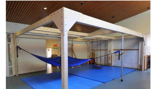
Doppel-Motorikzentrum mit Schiebepfosten