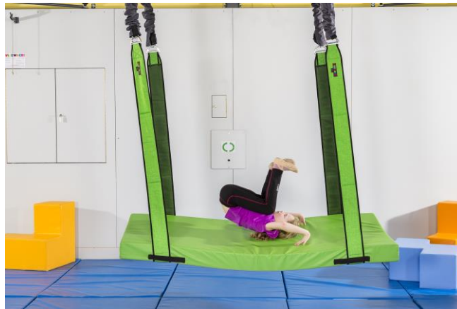
Wer traut sich, einen Purzelbaum in luftiger Höhe zu schlagen?