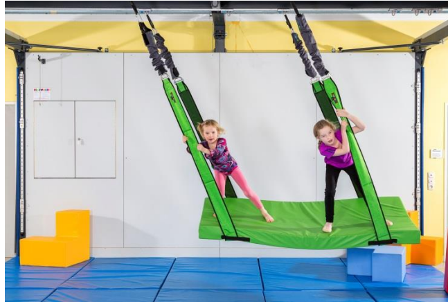
3D-Schaukeln durch Ergänzung von Elastikbänder-Sets