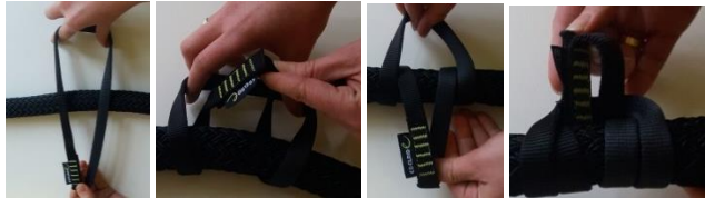
2 mal drumwickeln

Der Dschungel-Parcours ist für den Aufbau zwischen Decken und Wandschienen konzipiert worden. Wickeln Sie die Rundslingen um das angenehm griffige „Lianentau“-Seil. Hierbei ist zu beachten, dass die Rundslinge am Schild angefasst zweimal um das Seil gewickelt wird, um einen auf dem Seil verschiebbaren Prusik-Knoten herzustellen.